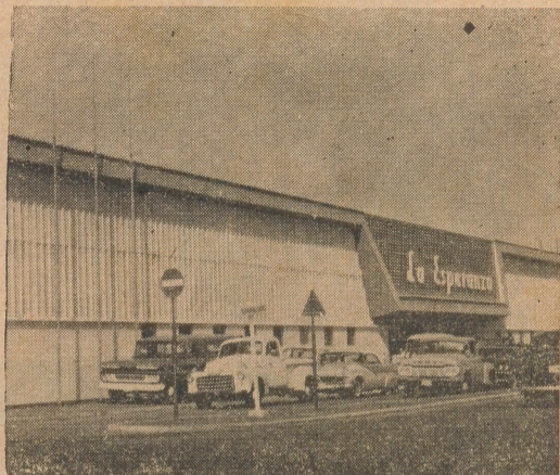
Esperanza Supermarket No. 2 Oranjestad